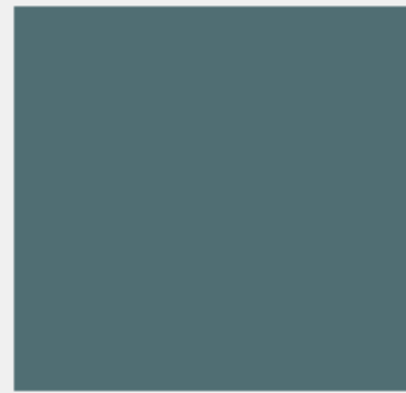
TONO AZUL LIGHT